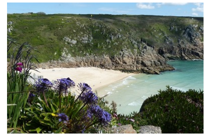
M1 : Bucht (Cornwall, England)