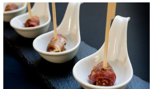
M2: Datteln im Speckmantel

bedeutet: ehrgeizig, strebsam, anspruchsvoll